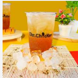
Dr Ice Tea