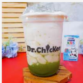
Creamy Delight Green Tea