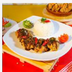
Chicken Crispy Blackpaper