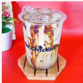
Dr Kopi Susu Gula Aren