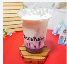
Creamy Delight Taro