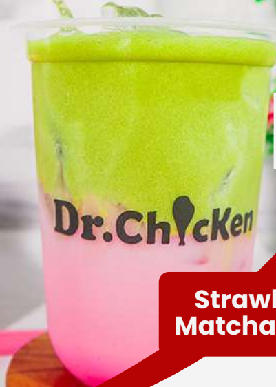
Strawberry Matcha Latte