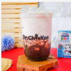
Creamy Delight Chocolate