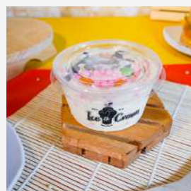
Dr Ice Cream