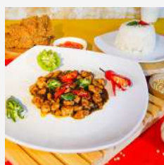
Ayam Lada Hitam