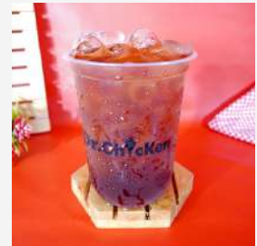
Dr Peach Tea