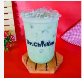
Dr Matcha Latte