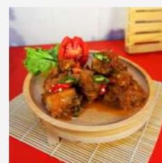
Ayam Pedas Madu