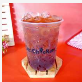
Dr Lemon Tea