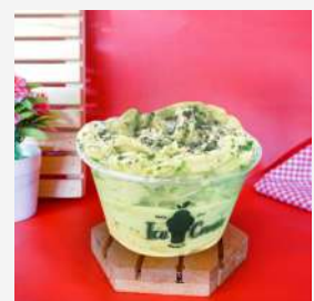
Dr Ice Cream Matcha Oreo