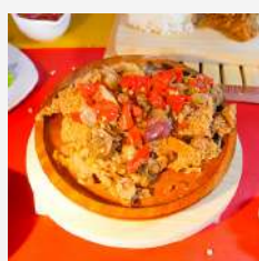
Ayam Sambal Matah