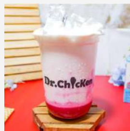
Creamy Delight Red Velvet