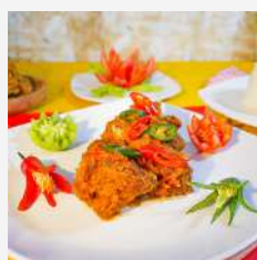
Ayam Asam Manis Pedas