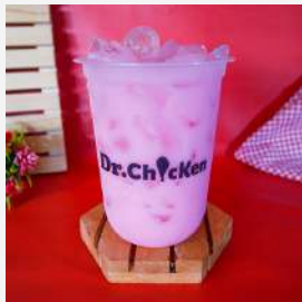
Dr Strawberry Milk Tea